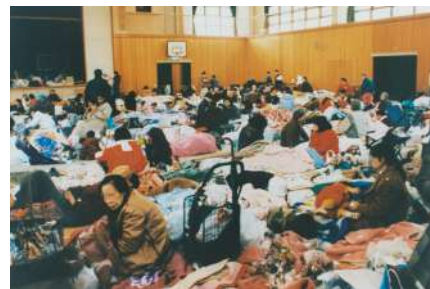
【当時の避難所の様子】

幾多の大災害を経験してきたわたしたちの社会が、今なおもって野宿・ホームレスへの差別意識を露わにしたことに、これまでの取り組みが報われず、25年が拒絶される苦々しい思いにいたられました。改めて、野宿者であろうと、ホームレスであろうと、いかなる生活困窮の状況であろうと、憲法の下で守られる人権、生活権や生存権、居住権などで犯されてはならない諸権利について、わたしたちの所有物とするための不断的努力を続けていかなければなりません。「由らしむべし、知らしむべからず」とする行政に対しては、生きる権利、生活を営む権利を手放すことなく、活かし用いるためにも主権者としての学び、権利獲得のための取り組みを続けていかなければならないことを確認させられるとともに、さらに再び繰り返させてはならないことを被災地責任として訴えていく覚悟を新たにさせられるものでした。四半世紀を経た今日、いっそう自己責任論が喝破し闊歩する社会に向けて声を上げ、可視化する取り組みを発信していかなければなりません。